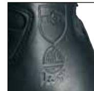
Schnittschutz Level 1