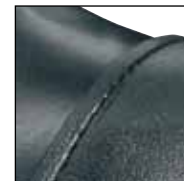
GÜK mit versenkten Nähten